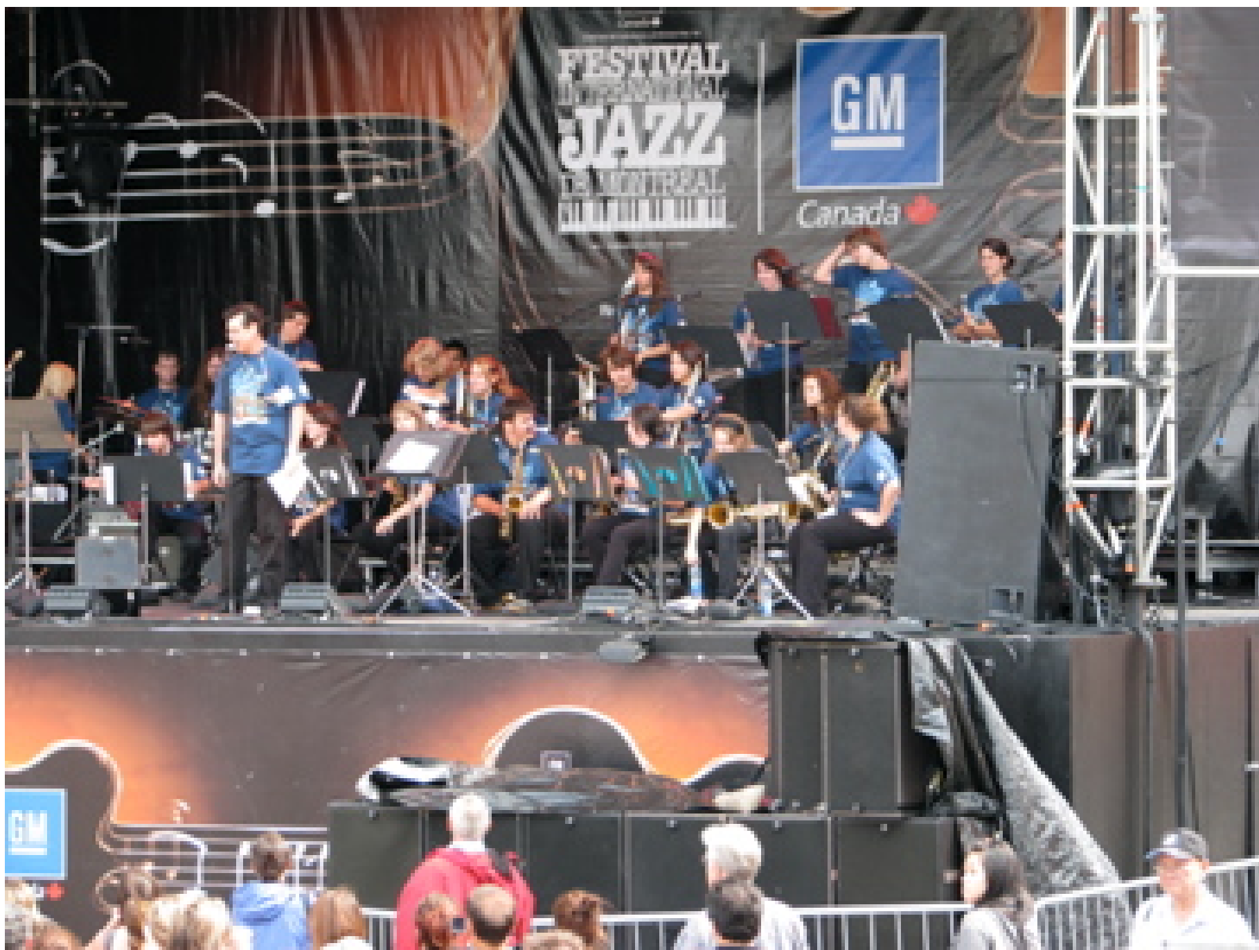
Le A.L. Blue Sharks lors de sa prestation au Festival international de Jazz de Montréal, le 3 juillet dernier.

Par Marie-Michèle Daigneault et Frédérique Gosselin