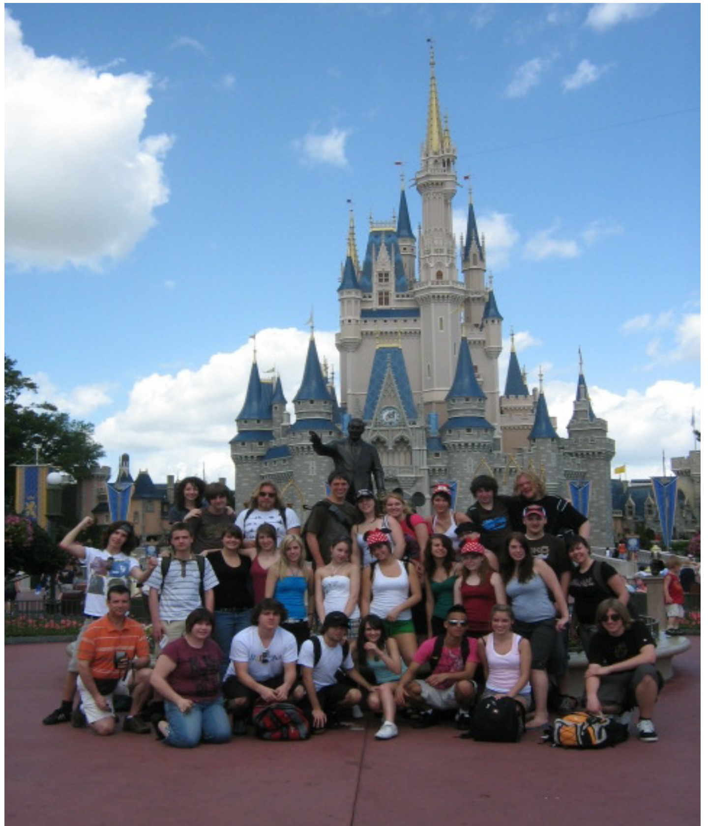
Les 29 élèves du A.L. Blue Sharks ainsi que leur enseignant devant le château du Magic Kingdom.